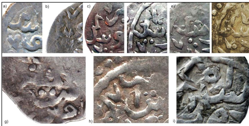
Рис. 1. Фрагменты штемпелей реверса дангов Крыма 822 г.х. (верхний ряд – qm822b.1; нижний ряд – qm822b.2)

го слова нельзя отличить от исполнения очевидного «чекан», демонстрирует рис. 2b,c,d).