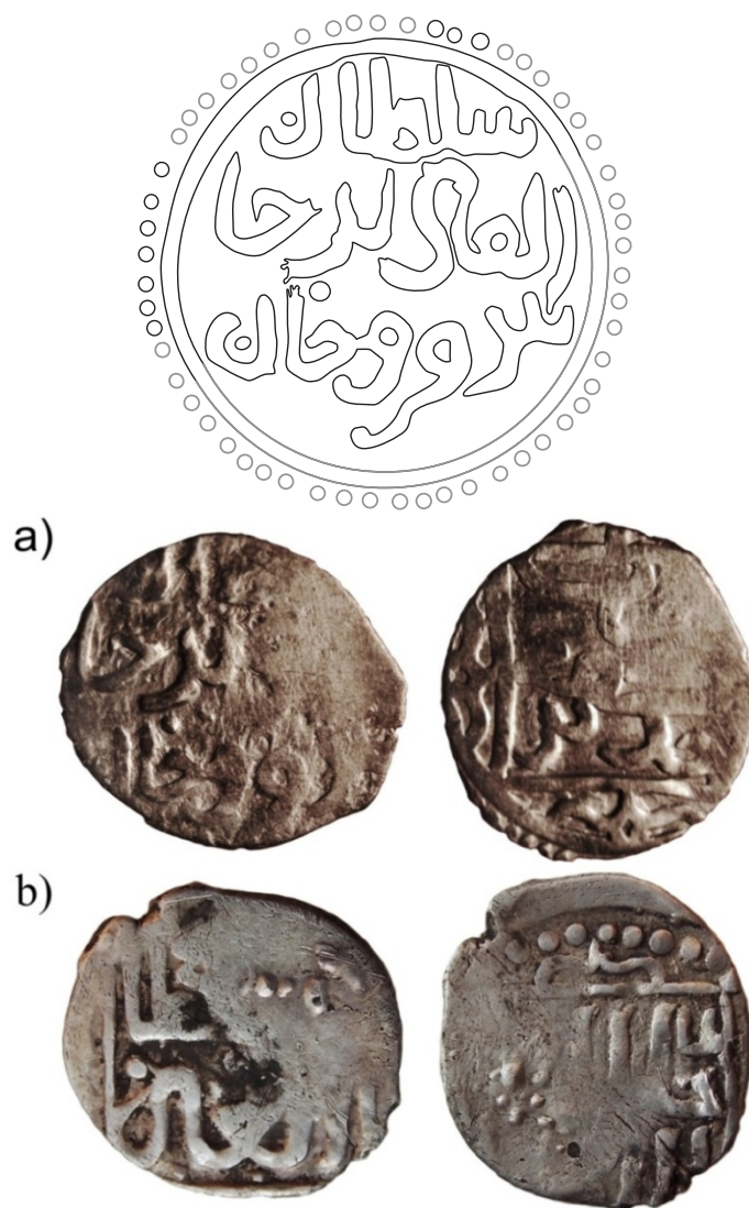
Рис. 3. а) данг, Яرخас?, Каффа, 825 г.х. (NB&c107602; auction.violity:142367); б) данг, Джалал ад-дин, Сарай?, 813–815 г.х. (NB&c108102).

представленному на рис. 3а) также принадлежат к одному из типов, использованных для чекана его дангов. Данный аверс является нумизматическим подтверждением династической неопределенности в Крыму в 825 г.х. просто потому, что имя Давлат Берди отсутствует там в принципе. Вместо него после «султан законный» (данный титул, заметьте, на дангах самого Давлат Берди не отмечен), написано нечто совершенно отличное, что возможно понимать как имя хана, поскольку оно написано на том месте, где и должно стоять имя. Желание увидеть на монете имя не сопрягается с безупречным