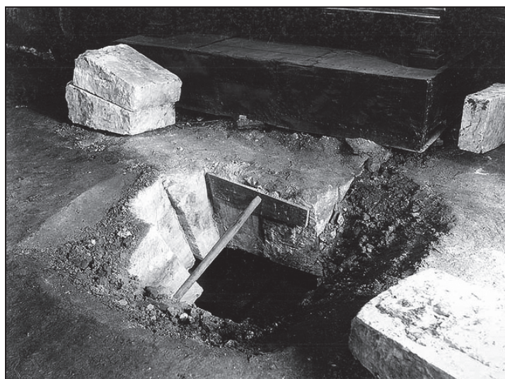
Рис. 1. Архангельский собор. Склеп у юго-западного столба с северной стороны, где похоронен Казанский царевич, во св. крещении Александр Сафакиреевич. Инв. номер КПоф 4866–34