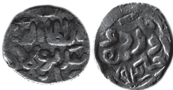
Рис. 2. Данг хана Бек-Булата с обозначением места чекана Орду ал-Джадид и датой 793 г.х. В = 1,15 г; Д = 16,5 × 14,5 мм.

793 г.х. датированы данги «чекана Орду ал-Джадид», неоднократно описанные в литературе, в т.ч. и К.К. Хромовым. Данг этого типа воспроизведен на Рис. 2.