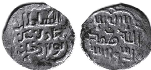
Рис. 10. Данг хана Бек-Булата с титулом «султан справедливый» и мусульманским символом веры на реверсе. В = 1,17 г.

Лицевым штемпелем данга на Рис. 9 бился и редкий монетный тип, воспроизведенный на Рис. 10. Здесь на реверсе отсутствует обозначение места чекана и приведен текст мусульманского символа веры.