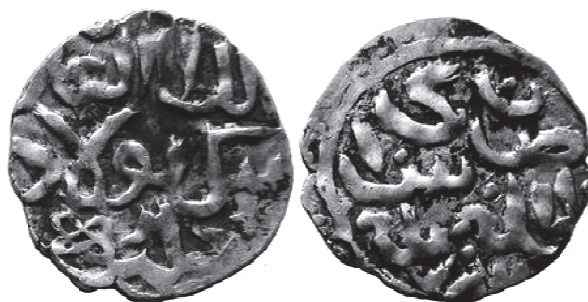
Рис. 1. Данг хана Бек-Булата с обозначением места чекана Сарай ал-Джадид. В = 1,17 г; Д = 17 мм; zeno.ru #105437.

По положению на 2015 г. автору известны четыре экземпляра такого типа дангов (Рис 1), отчеканенных одной парой штемпелей. Строго говоря, до накопления необходимого для надежных заключений нумизматического материала, нельзя утверждать, что эти монеты бились именно в Сарае, ибо, как правильно заключил Л.Б. Добромыслов, «существует две атрибуции у каждой монеты – формальная (почерпнутая из прочтения монетных легенд) и фактическая (уточняющая истинное место, а иногда и время чеканки, и даже эмитента)» [5, с. 28]. Однако «формальная атрибуция», которая в данном случае пока не опровергнута «фактической», позволяет на данном этапе утверждать, что сведения письменных источников о захвате Бек-Булатом Сарая получают и нумизматическое подтверждение.