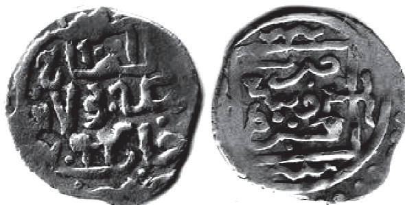
Рис. 7. Данг хана Бек-Булата с обозначением места чекана Крым ал-Махруса и датой 794 г.х. В = 1,11 г; Д = 16 × 15 мм.

На Рис. 7 воспроизведен данг с обозначением места выпуска как «Ал-Махруса Крым». Монета датирована на лицевой стороне 794 г.х. (29 ноября 1391 – 16 ноября 1392), что коррелирует с рассказом Ибн Халдуна.