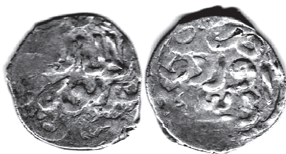
Рис. 3. Данг хана Бек-Булата с обозначением места чекана Орду и датой 793 г.х.

Монеты Бек-Булада, чеканенные в Орду, в недавней статье К.К. Хромова отсутствуют, но упомянуты (без прорисовок) в классических трудах Х.М. Френа [25, № 2, с. 357] и А.К. Маркова [7, № 1229, с. 491]. Поэтому необходимо не только воспроизвести фотоизображение этого типа, но и расписать легенды реверса. На Рис. 3 приведен экземпляр этого типа.