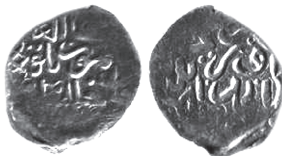
Рис. 6. Данг хана Тимур-Кутлуга, отчеканенный в Орду ал-Джадид в 802 г.х. В = 1,1 г; Д = 15 × 17 мм.

приведен данг хана Тимур-Кутлуга чекана Орду ал-Джадид 802 г.х., где имя хана تيمور قو تلو написано как تيمور قو . Известны и данги 801 г.х. с таким вариантом написания имени.