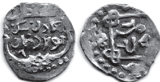
Рис. 9. Данг хана Бек-Булата с титулом «султан справедливый» и легендой на реверсе «отчеканено в области». В = 1,17 г.

На Рис. 9 воспроизведен данг, также «чеканенный в области», но титул Бек-Булата на его аверсе дан как «султан справедливый».