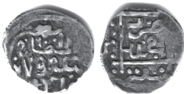
Рис. 8. Данг хана Бек-Булата с титулом «султан», датой 794 на аверсе и легендой на реверсе «отчеканено в области». В = 1,19 г; Д = 16 × 15 мм.

Война между Токтамышем и Бек-Булатом в Крыму, как свидетельствуют письменные источники, заняла довольно продолжительный отрезок времени. Это, как видится, отражено и на монетах. На Рис. 8 дано фотоизображение монеты Бек-Булата, «чеканенной в области» с титулом «султан» на аверсе. Штемпелем ее лицевой стороны бились и данги с обозначением места чеканки Крым ал-Махруса.