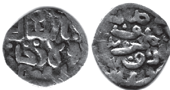
Рис. 4. Данг хана Булата, отчеканенный в Азаке ал-Махруса. В = 1,4 г; Д = 17 × 15,7 мм.

Существует еще один тип дангов, имеющий отношение к рассматриваемым событиям (Рис. 4).