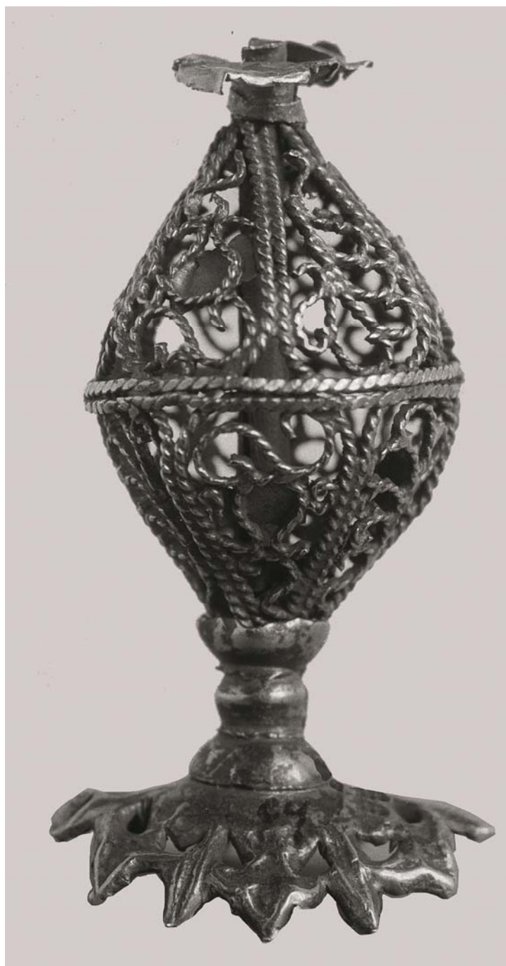
Рис. 8. Джукетаусский клад. Навершие головного убора. Золото, филигрань. XIV в. По: [18, с. 129, рис. 2]

Fig. 8. Juketau hoard. Top of the headdress. Gold, filigree. Fourteenth century. According to: [18, p. 129, fig. 2]