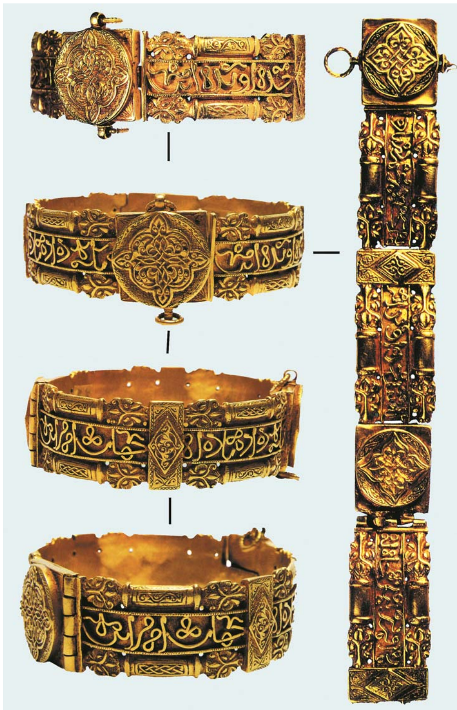
Рис. 1. Джукетауский клад. Браслет. Золото. XIV в. ГЭ, инв. № 30-717. По: [7, с. 229, кат. 131; 29, с. 88, кат. 111]