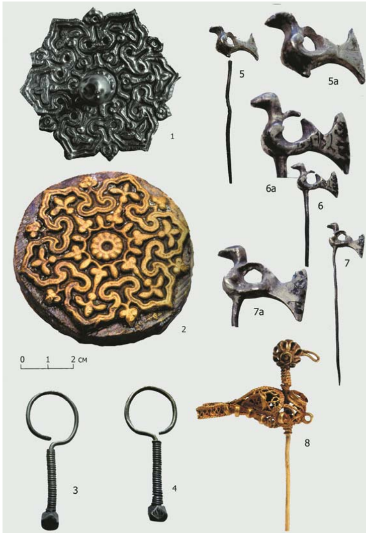
Рис. 7. Изделия из серебра и бронзы (2). Карашамский клад (1,3-7) и Булгарское городище (2,8). 1 – навершие головного убора. Серебро. XIV в. По: [9, с. 116, рис. 37]; 2 – матрица для изготовления наверший. Бронза. XIV в. БГИАМЗ, инв. № 1443-176/412 арх. По: [16, с. 172, кат. 20.2.11]; 3 – серебряная серьга в виде знака вопроса. НМ РТ, инв. № 11451, 4 – серебряная серьга в виде знака вопроса. НМ РТ, инв. № 11466. По: [24, с. 463, кат. 310, 311]; 5 – серебряная заколка. НМ РТ, инв. № 11435; 6 – серебряная заколка. НМ РТ, инв. № 11464; 7 – серебряная заколка. НМ РТ, инв. № 11434. По: [24, с. 496, кат. 383-385]; 8 – золотая филигранная заколка. Булгар. По: [7, с. 152, кат. 67]

Fig. 7. Silver and bronze items (2). Karasham hoard (1,3-7) and Bolghar settlement (2,8). 1 – headdress pommel. Silver. Fourteenth century. According to: [9, с. 116, рис. 37]; 2 – matrix for making pommels. Bronze. Fourteenth century. Bolghar Museum-Reserve, inventory number 1443-176/412 арх. According to: [16, p. 172, cat. 20.2.11]; 3 – silver question mark earring. National Museum of the Republic of Tatarstan, inventory number 11451, 4 – silver question mark earring. National Museum of the Republic of Tatarstan, inventory number 11466. According to: [24, p. 463, cat. 310, 311]; 5 – silver hairpin. National Museum of the Republic of Tatarstan, inventory number 11435; 6 – silver hairpin. National Museum of the Republic of Tatarstan, inventory number 11464; 7 – silver hairpin. National Museum of the Republic of Tatarstan, inventory number 11434. According to: [24, p. 496, cat. 383-385]; 8 – gold filigree hairpin. Bolghar. According to: [7, p. 152, cat. 67]