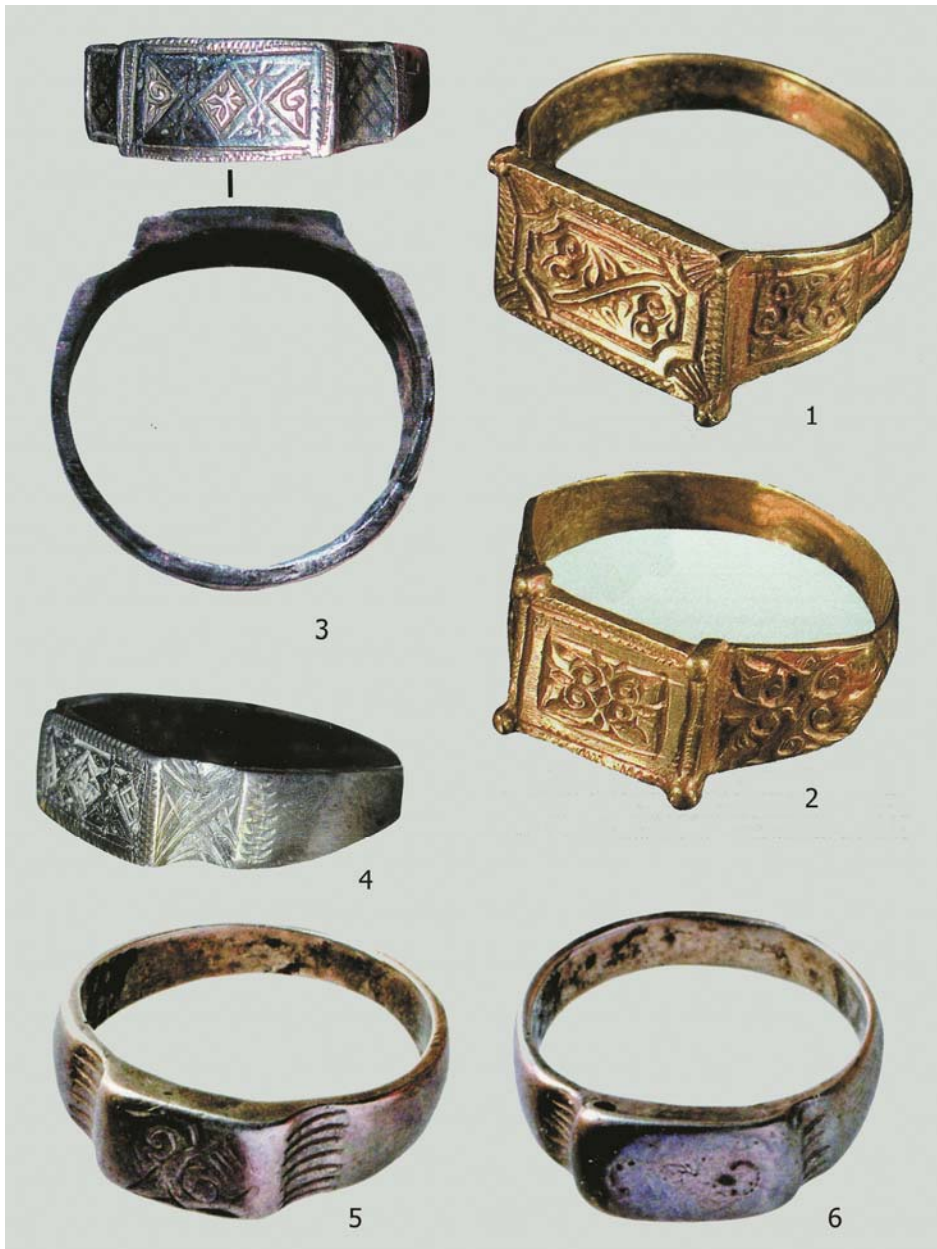
Рис. 5. Карашамский клад. Перстни. Золото (1,2) и серебро (3-6). 1 – НМ РТ, инв. № 11422; 2 – НМ РТ, инв. № 11424; 3 – НМ РТ, инв. № 11425; 4 – НМ РТ, инв. № 11426; 5 – НМ РТ, инв. № 11458; 6 – НМ РТ, инв. № 11456. По: [24, с. 374–375, 388, 451, 452, кат. 55, 59, 60, 100, 259, 262]