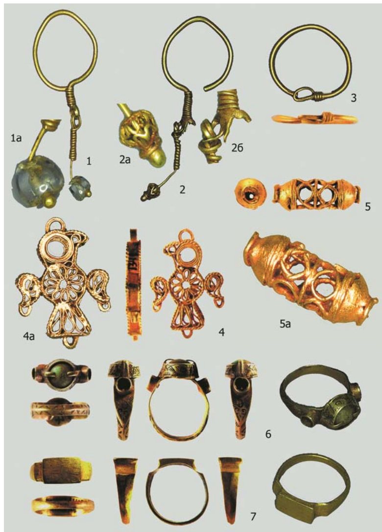
Рис. 6. Булгарский клад из золотых предметов 2010 года (раскоп СХLIX, соор. 14а; исследование В.С. Баранова). Первая половина XIV в. 1,2 – серьги в виде знака вопроса (БГИАМЗ, инв. №1338, 13340/412 арх.); 3 – проволочное кольцо (БГИАМЗ, инв. №1339/412 арх.); 4 – филигранная подвеска в виде птицы (БГИАМЗ, инв. №1341/412 арх.); 4а – обратная сторона (увеличено); 5 – филигранная пронизка (БГИАМЗ, инв. №1342/412 арх.); 5а – увеличено; 6 – перстень со вставками (БГИАМЗ, инв. №1337/412 арх.); 7 – литой перстень (БГИАМЗ, инв. №1343/412 арх.).

По: [16, с. 196–197, кат. 22.3.31–22.3.37]