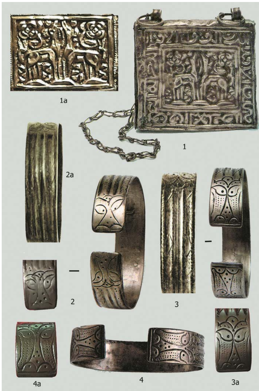
Рис. 4. Крещено-Елтанский клад 1900 г. Изделия из серебра. 1; 1а (оборотная сторона) – капторга; 2-4 – браслеты. 1 – ГЭ, инв. № V3-108; 2 – ГЭ, инв. № 30-338; 3 – ГЭ, инв. № 30-337; 4 – ГЭ, инв. № 30-336. По: [7, с. 230, 316, кат. 113, 237]

Fig. 4. Krescheno-Eltansky hoard of 1900. Silverware. 1; 1a (reverse) – kaptorga; 2-4 – bracelets. 1 – State Hermitage Museum, inventory number V3-108; 2 – State Hermitage Museum, inventory number 30-338; 3 – State Hermitage Museum, inventory number 30-337; 4 – State Hermitage Museum, inventory number 30-336.