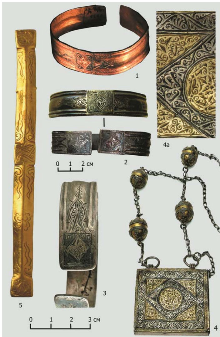
Рис. 3. Золотые, серебряные браслеты (1-3,5) и капторга (4). 1 – золотой браслет из Булгара, коллекция А.Ф. Лихачева (НМ РТ, инв. № 5838). По: [25, с. 247, рис. 3: 3]; 2 – серебряный браслет, Карашамский клад (НМ РТ, инв. № 11437). По: [25, с. 252, рис. 5: 10,11]; 3 – серебряный браслет, Карашамский клад (НМ РТ, инв. № 11440). По: [7, с. 252, рис. 5: 13]; 4 – серебряная капторга с позолотой, Пермская губ. (ГЭ, инв. №V3-941); 4a – деталь. По: [7, с. 234–235, кат. 137]; 5 – заготовка золотого браслета из Селитренного городища (раскопки Г.А. Федорова-Давыдова, 1980 г.), Астраханский музей-заповедник, инв. № 31062. По: [6, с. 161, кат. 107]

Fig. 3. Gold, silver bracelets (1-3,5) and a kaptorga (4). 1 – gold bracelet from Bolghar, collection of A.F. Likhachev (National Museum of the Republic of Tatarstan, inventory number 5838). According to: [25, p. 247, fig. 3: 3]; 2 – Silver bracelet, Karasham hoard (National Museum of the Republic of Tatarstan, inventory number 11437). According to: [25, p. 252, fig. 5: 10,11]; 3 – silver bracelet, Karasham hoard (National Museum of the Republic of Tatarstan, inventory number 11440). According to: [7, p. 252, fig. 5: 13]; 4 – silver kaptorga with gilding, Perm province (State Hermitage Museum, inventory number V3-941); 4a – detail. According to: [7, p. 234–235, cat. 137]; 5 – semi-finished gold bracelet from the Selitrennoe settlement (excavations by G.A. Fedorov-Davydov, 1980), Astrakhan Museum-Reserve, inventory number 31062. According to: [6, p. 161, cat. 107]