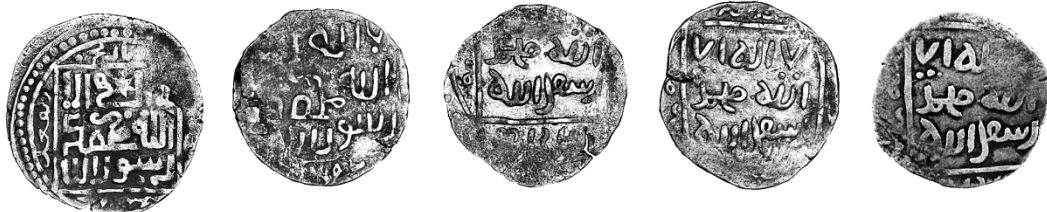
Рис. 1 / Fig. 1