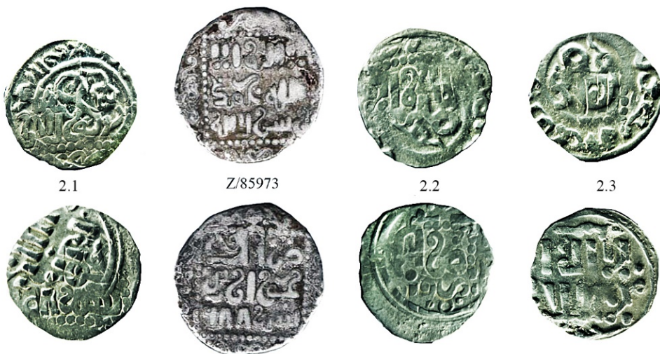
Рис. 2. Монеты № 2.1-2.3 – перечеканка из дирхамов Хорезма.

Эта информация в совокупности с принадлежностью упомянутых территорий юрту Джучидов неопровержимо свидетельствуют о том, что изучаемая тамга не может принадлежать хану Гуюку, но она маркирует владельца улуса одной из ветвей Джучидов.