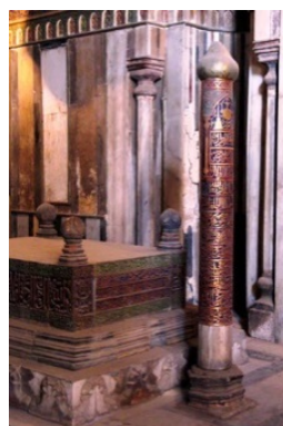
Рис. 4. Ханака и медресе ас-султан Фарадж ибн Баркук и могила Баркука.