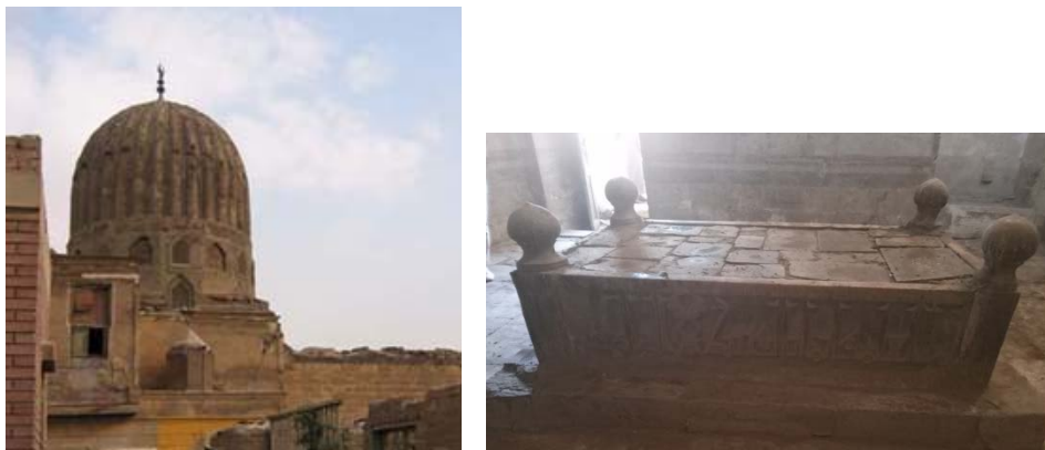
Рис. 2. Мавзолей и гробница золотоордынской невесты Тулбии. Fig. 2. Mausoleum and tomb of the Golden Horde queen, Tulbiya.

мавзолея находится мраморный саркофаг, с трех сторон начертаны куфические надписи гротескным письмом, впереди указана дата смерти 765 г.х.: «Во имя Аллаха милостливого, милосредного. Дата смерти госпожи Тулбии, пусть Аллах будет к ней милосерден умерла 17 джумга раби'а ал-ахира в году 765».