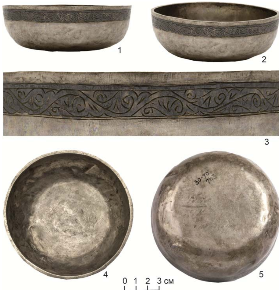
Рис. 3. Серебряная чаша из коллекции Государственного Эрмитажа. Fig. 3. Silver bowl from the collection of the State Hermitage Museum.