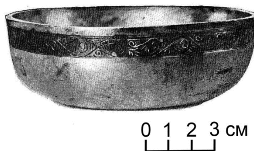
Рис. 4. Серебряная чаша из коллекции Государственного исторического музея (по: [2, с. СIII, № 240]). Fig. 4. Silver bowl from the collection of the State Historical Museum (according to: [2, p. СIII, No. 240]).