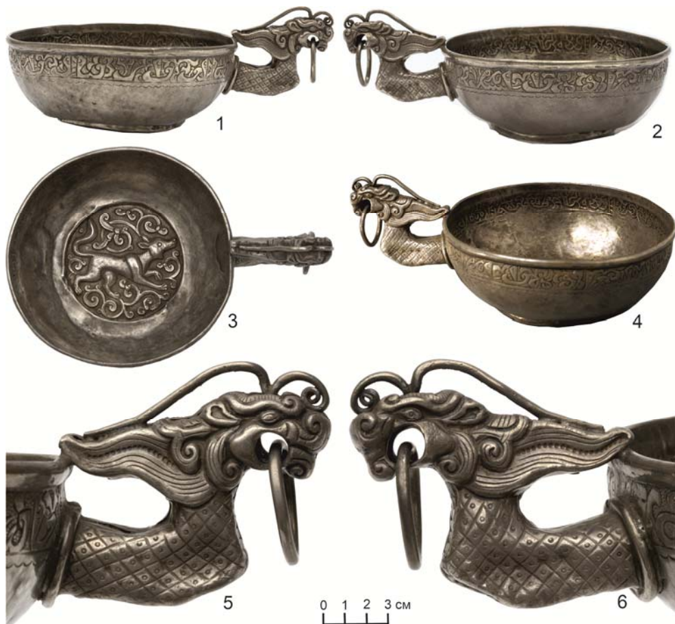
Рис. 1. Серебряный ковш с протомой дракона (из коллекции Государственного Эрмитажа). Fig. 1. Silver ladle with a dragon protome (from the collection of the State Hermitage Museum).