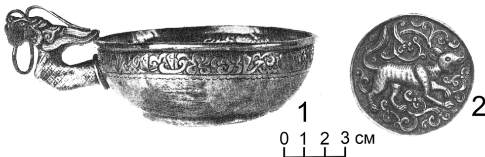
Рис. 2. Серебряный ковш с протомой дракона (из коллекции Государственного исторического музея, по: [2, с. СIII, № 237]). Fig. 2. Silver ladle with a dragon protome (from the collection of the State Historical Museum, according to: [2, p. СIII, No. 237]).