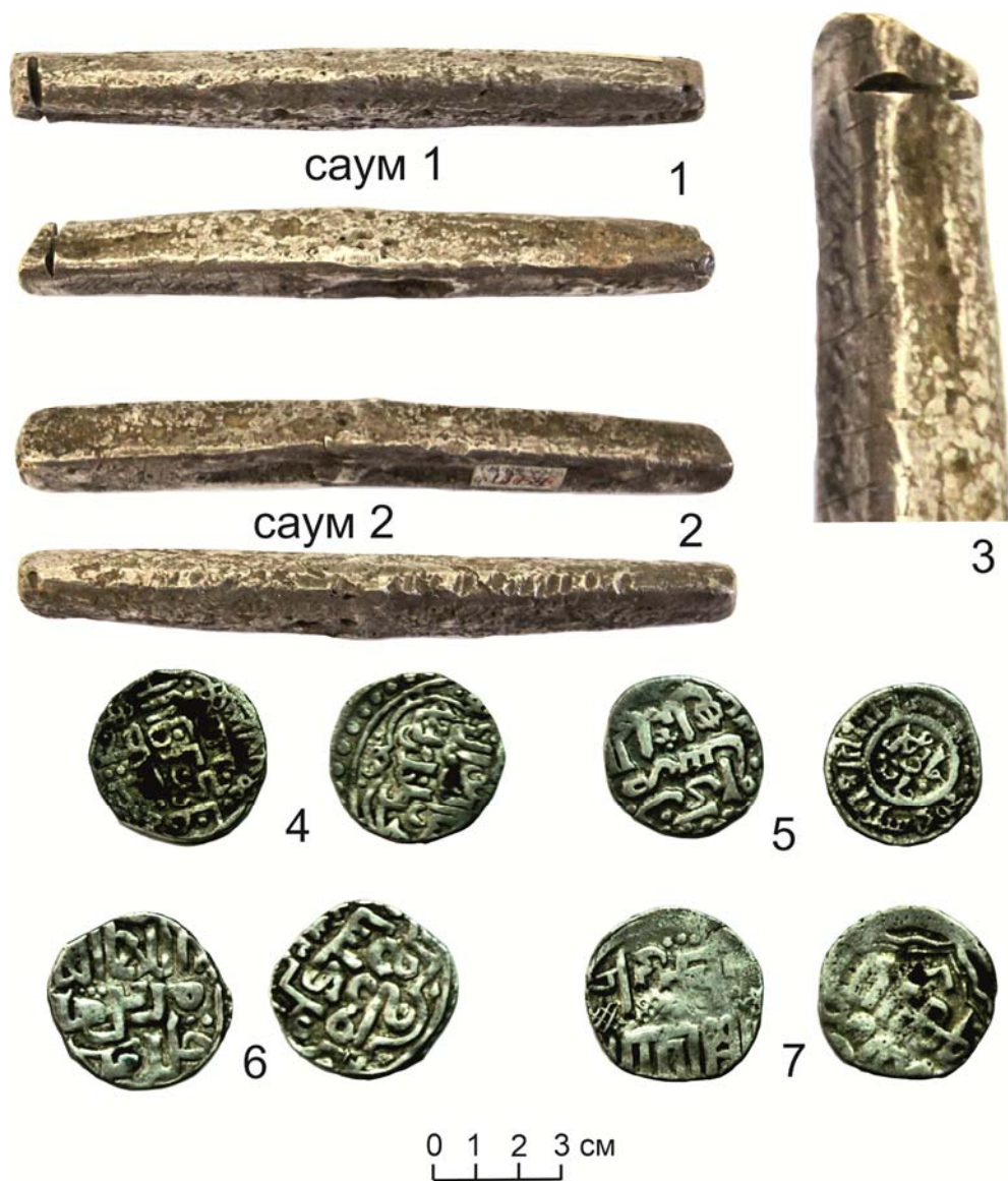
Рис. 5. Саумы и монеты (из коллекции Тобольского историко-архитектурного музея-заповедника)

что клады датируются по самому молодому предмету. Это значит только то, что в этом момент все вещи были в обращении одновременно. Но, естественно, период обращения каждого предмета мог быть индивидуальным.